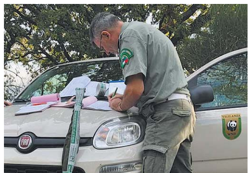
Caccia Controlli del Wwf nelle campagne dello Spoletino con multe e sequestri

Caccia, controlli e multe da parte delle Guardie del Wwf di Perugia a Protte, Bazzano Superiore, Uncinano. "Numerosi i cacciatori che controllati - scrive il Wwf - sono poi stati multati. In alcune occasioni è scattato anche il sequestro del fucile". Le irregolarità emerse riguardano, stando a quanto afferma il Wwf, caccia a distanza irregolare dalle strade, caccia alla lepore con il posizionamento della "posta" direttamente