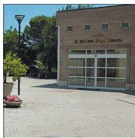
Ospedale San Matteo all'avanguardia

laboratorio scientifico di bolle di sapone e poi rappresentato in teatri e festival nazionali e internazionali (Francia, Irlanda, Belgio, Svizzera, Grecia, Giappone, Cina, Corea del Sud), in scuole materne, musei della scienza, casinò, varietà e gran galà. L'artista Michele Cafaggi è attivo nel panorama teatrale dai primi anni '90 ed è "Dottor Sogno" presso i reparti pediatrici dove opera la Fondazione Theodora onlus.