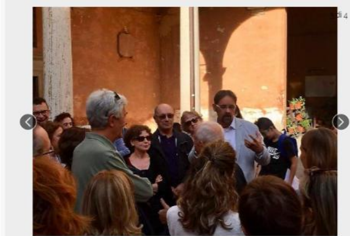
EVENTI Tirano i "Luoghi invisibili", torna anche la Pelosissima 13/10/2018 - 12:25