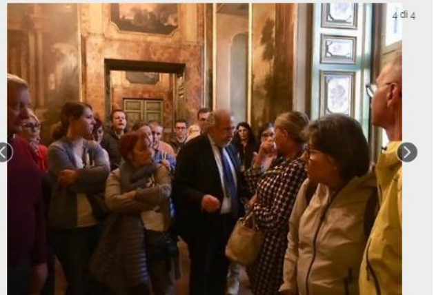
EVENTI Tirano i "Luoghi invisibili", torna anche la Pelosissima 13/10/2018 - 12:25