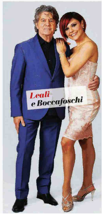
Leali e Boccafoschi

DALLE BRIOCHE "SALVAVITA" DELLA PARIETTI AI CAGNOLINI DEL GIGANTE DEL RUGBY CHE PORTANO FORTUNA: MAI VISTE TANTE STRANEZZE A BORDO PISTA!