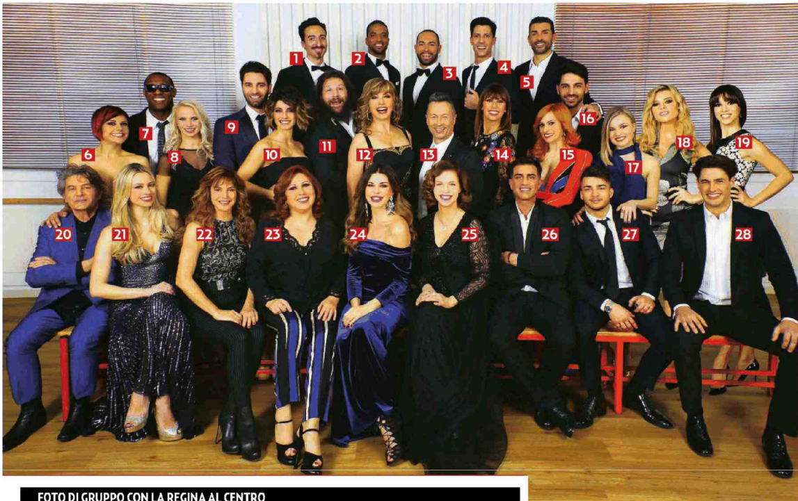
FOTO DI GRUPPO CON LA REGINA AL CENTRO