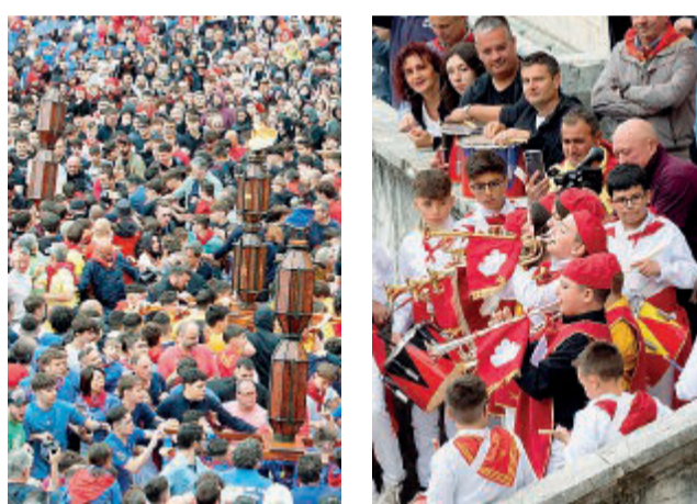
Momenti unici Alcune immagini della giornata di festa

Deciso anche l'attacco al monte: cade Sant'Ubaldo sul primo stradone, cade San Giorgio un po' più in alto. L'arrivo a Sant'Ubaldo in 12 minuti con San Giorgio che