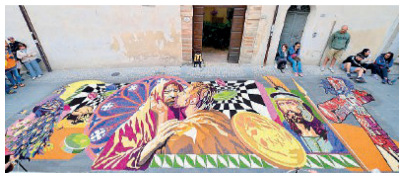
Concorso A sinistra Il bacio di Giuda Sotto alcuni momenti della 61esima edizione e la processione