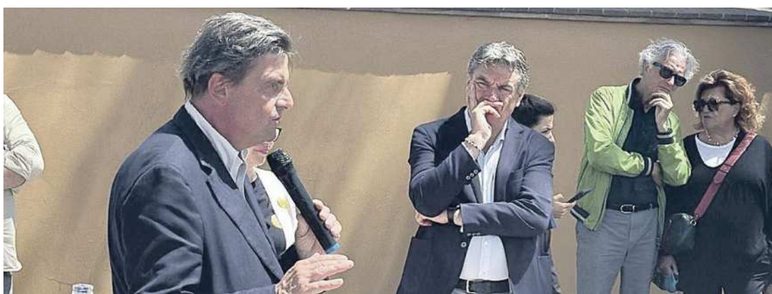
Calenda durante l'incontro con i cittadini a Perugia

PERUGIA Europa uber alles nella sua campagna elettorale, ma siamo a Perugia e l'esperimento di Carlo Calenda stringe i confini pur allargando le vedute. Perché nella terra umbra il fondatore di Azione sostiene il centrosinistra, quello che vede il Pd in testa a dominare e altre liste a fianco in una sorta di impegnata complicità. A pag. 35