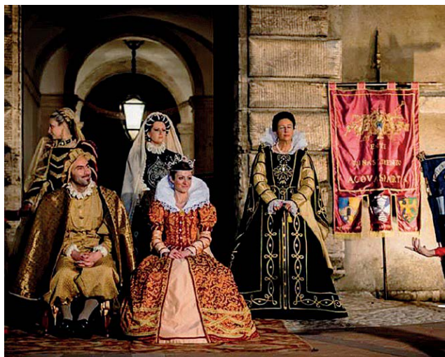
Rievocazioni storiche Al centro il Palio del Cupolone in programma a Santa Maria degli Angeli, ad Assisi. Sopra e in alto a destra La Festa del Rinascimento che si tiene ad Acquasparta fino al 23 giugno

In costumi d'epoca per richiamare antiche atmosfere