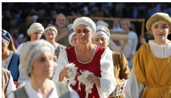
A spasso nella storia, il ritorno di "Perugia 1416". Oggi l'anteprima nel segno della ciaramicola

Anteprima di Perugia 1416 con tavola rotonda sulla ciaramicola. Da domani sfide medievali e corteo storico per il Palio. Eventi culturali e taverne aperte oggi.