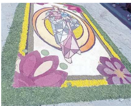
L'infiorata a San Gemini