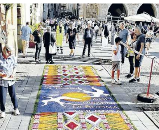
L'infiorata di Spello