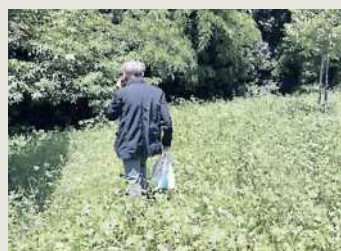
Il parco Ciaurro

appello. La prima è rivolta ad Asm e Ater per gli interventi a loro carico non eseguiti (lo sfalcio in via Eroi dell'Aria, via Borzacchini, viale dello Stadio, via Aleardi per Asm, nelle zone di San Giovanni alto, Cospea, San Lucio, via Brodolini e Quartiere Italia per l'Ater), il secondo è un