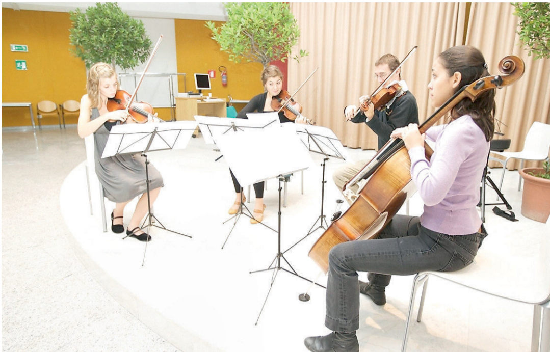
• Da domani e per tutto il periodo delle feste natalizie si terranno tanti piccoli eventi musicali