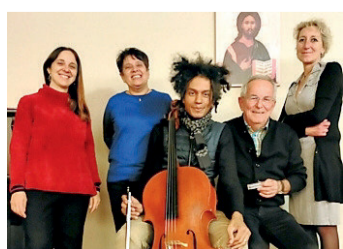
• Il Coro Santa Chiara