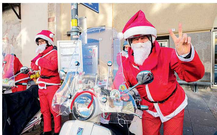
• Domani in piazza Don Bosco ci saranno anche i Babbi Natale in vespa

BOLZANO. Appuntamento col "Natale dei bambini" domani, sabato 3 dicembre, dalle 15 alle 17 in piazza Don Bosco. Un Natale all'insegna della condivisione, del riciclo e dello scambio. La San Vincenzo ha raccolto moltissimi giocattoli che sono stati donati da bambini diventati grandi e che non li usano più. In nome del "no allo spreco" e del riuso, verranno consegnati dai Babbi Natale speciali del Vespa Club Bolzano (che domenica 18 dicembre sfilerà come ogni anno per le strade della città per raccogliere fondi da devolvere in beneficenza), a tutti i bambini e a tutte le bambine che arriveranno in piazza Don Bosco. Così potranno far rivivere tanti bellissimi giocattoli ancora perfettamente funzionanti che altrimenti finirebbero