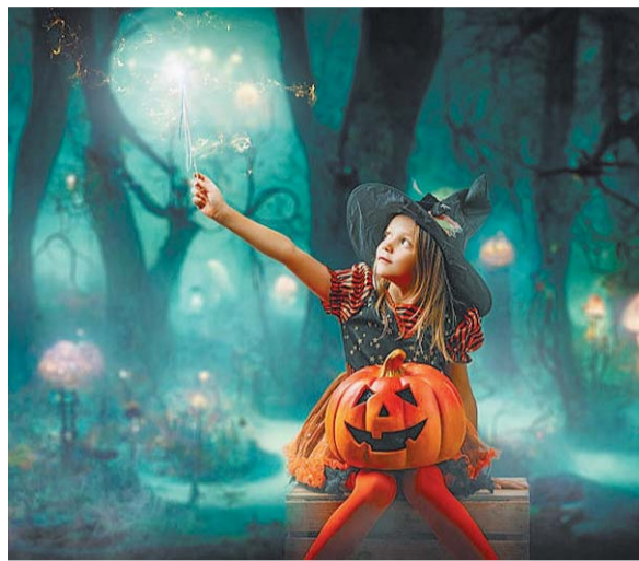
Festa di Halloween Appuntamenti pure a Perugia, Terni e Narni

Fervono i preparativi per la festa di Halloween che tanto amano piccoli e grandi. Il parco divertimenti di Città della domenica, a Perugia , è pronto ad accogliere così i visitatori nel fine settimana più "mostruoso" dell'anno, quello che include la festa di Halloween, per due grandi giornate a tema, domenica e lunedì, tra spettacoli, favole e racconti per bambini. I piccoli avventurieri, che fin dalla mattina potranno recarsi al parco, riceveranno una mappa all'ingresso dove sono indicati i posti in cui si nascondono gli abitanti di Città della Domenica, Teschio Bianco, il Conte Vampiro e la sciamana Luna che splende: questi personaggi fanno parte del game nel quale bisognerà sconfiggere l'armata di zombie e fantasmi che infestano il parco e si preparano a conquistare il mondo, sotto la guida di Gundak, che ha scatenato il suo oscuro potere. Il gioco d'avventura si svolge in diversi luoghi del parco, proprio per portare i bambini a muoversi e scoprire la sua bellezza naturale. Domani dalle 14.30 la Pro Loco di Marmore