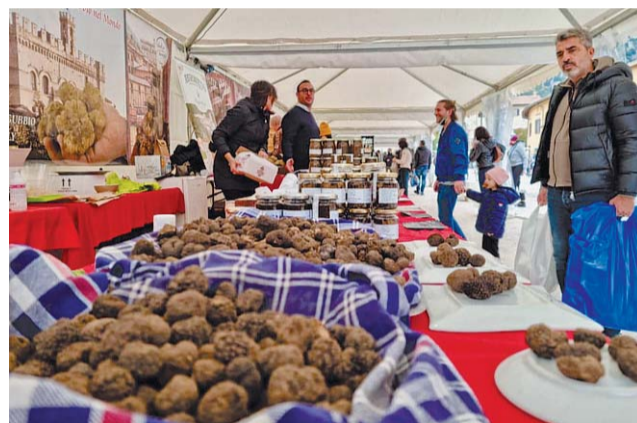
Mostra del tartufo bianco Oltre a Gubbio è in calendario anche in Altotevere, a Città di Castello per la precisione

primo novembre; mentre a Tuoro sul Trasimeno ci sarà la "Festa dell'olio". Inoltre pane, olio e una chiacchierata con l'almanacco più famoso d'Italia in un pomeriggio autunnale accanto al fuoco acceso. È così che Barbanera