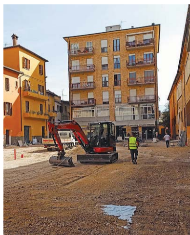
Piazza Giacomini Lavori in corso