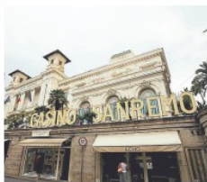
► Sanremo Fiori anche sul Casinò

Alle 18 del 14 'Pasqua in Fiore' si apre con la scenografica in-