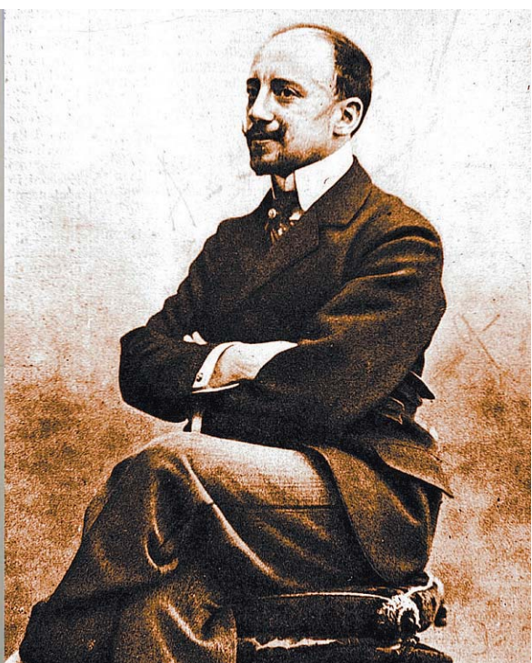
La lettera La scrisse D'Annunzio al parroco di Gardone Riviera, si compiaceva di provocare scandalo nel sacerdote parlando di Barbanera