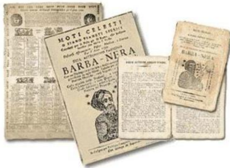
Un'edizione antica dell'Almanacco di Barbanera: il suo fascino è sempre intatto

Nello stile e nei contenuti, l'edizione dei 260 anni si rende come sempre interprete di un mondo che vuole riappropriarsi del piacere delle cose semplici e di un rapporto armonioso con la natura e di mese in mese, una stagione dopo l'altra, propone tante curiosità, notizie e suggerimenti per la casa, la famiglia, l'orto e il giardino, per la cucina e per il benessere di corpo e mente. Insomma, per uno stile di vita sostenibile e consapevole, sempre in armonia con i cicli delle stagioni. E poi ci sono il meteo e le feste, i proverbi e i fenomeni celesti, perché è la luna a guidarci e a scandire i tempi delle nostre attività: non soltanto seminare, raccogliere e pota-