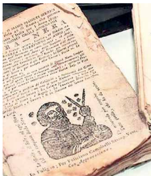
• L'Almanacco Barbanera compie 260 anni

che, previsioni meteo, saper fare per il frutteto e l'orto, per il cortile e la casa. Con le lune, i santi, i proverbi e un italiano, semplice e pulito, ad unire un Paese che ancora non si comprendeva. Oggi - mutatis mutandis - l'Almanacco segna ancora il crinale tra la fine di un anno e il buon inizio di quello nuovo, continua a scandire il tempo, le stagioni, le cose da fare e da sapere, le quotidianità di milioni di italiani che ora abitano in città. Racconta una storia, una tradizione, uno stile di vita