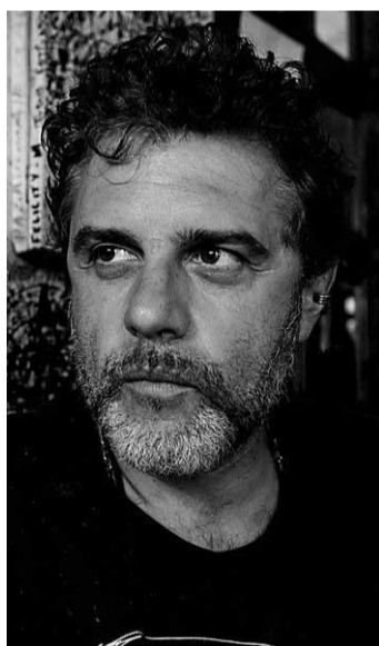
• Valerio Bispuri

dicato la sua attenzione alle persone, un'indagine sullo stato mentale e fisico dell'essere umano quando è privo della libertà. Bispuri, pluripremiato fotoreporter romano, collabora con numerose riviste italiane e straniere. Tra i suoi lavori principali Encerrados, sulla vita in 74 carceri maschili e femminili nei paesi sudamericani, e Paco, progetto che denuncia la diffusione e gli effetti di una droga a basso costo in Sudamerica.