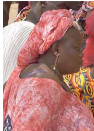
• Oggi i docu-film di Scerbo