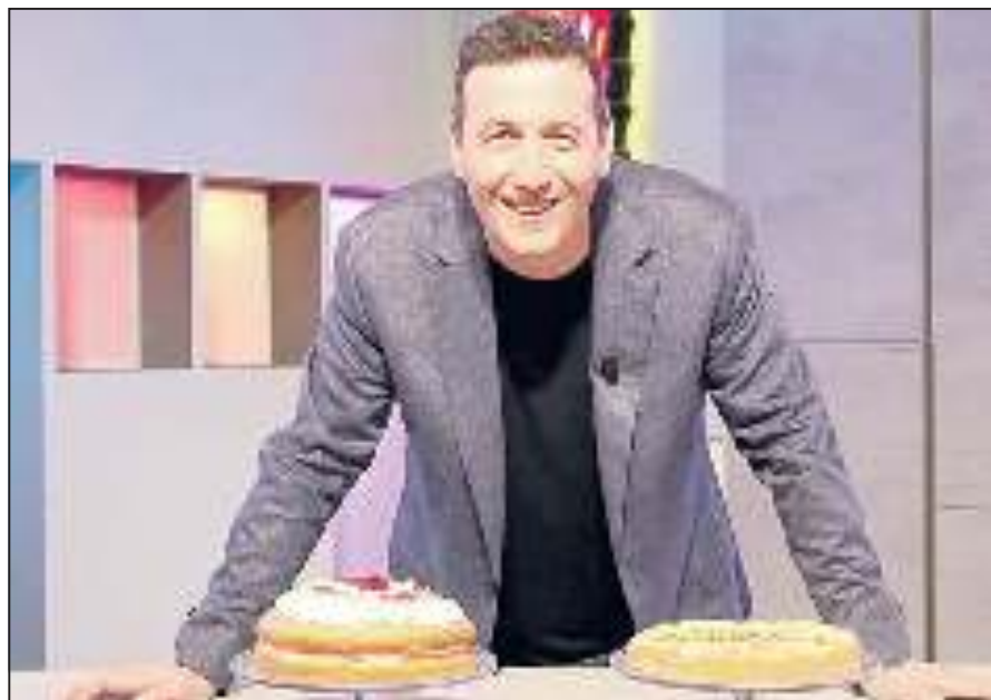
Alessandro Greco sabato su Rai2 l'ultima puntata di "Dolce quiz"

«Purtroppo devo trattenermi, perché ho la tendenza ad ingrassare, ma mi piace