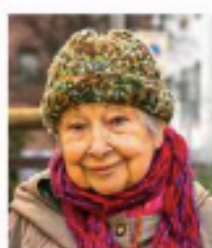
Lidia Menapace, 96 anni

La storica partigiana. Si è sentita male nella sua casa di Corso Libertà per colpa del Covid: a 96 anni è ricoverata al San Maurizio Messaggi da tutta Italia: «Non mollare, ce la farai ancora» > Carpiestrini a pag. 19