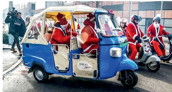
• L'Ape d'Avvento riscalda il motore

BOLZANO. Neve e pioggia permettendo, arriva l'Ape d'avvento. Da venerdì 4 dicembre e fino alla Vigilia, secondo un calendario che pubblicheremo sul giornale, un'Ape natalizia porterà gli auguri in musica del Comune direttamente sotto casa dei bolzanini e bolzanine, nel pieno rispetto delle normative anti Covid. Domani si parte verso le 17.30 nella zona via Cagliari, via Alessandria, ma ovviamente tutto dipende dalle condizioni meteo. Gli appuntamenti che potrebbero saltare per pioggia o neve verranno recuperati in seguito. D'altronde l'Ape si muove così, con l'altalena del sole e delle nubi. L'iniziativa è promossa dall'Assessorato ai giovani e al decentramento in collaborazione con l'Alto Adige e il Vespa Club Bolzano. Sull'Ape viaggeranno due musicisti che nelle diverse tappe proporranno dei brani d'ispirazione natalizia. Se qualcuno desidera una cantata sotto casa, non ha che da chiederlo man-