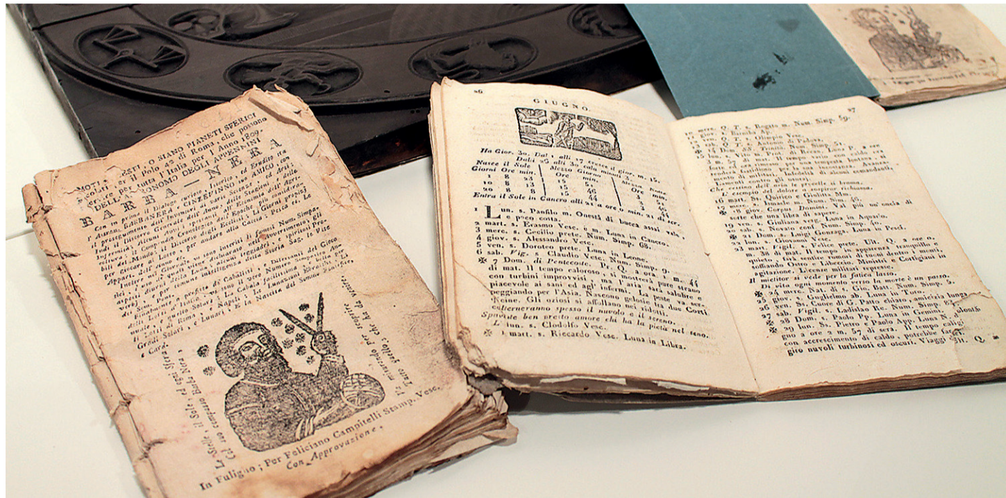
• Consigli utili e buone pratiche dal 1762, è l'Almanacco di Barbanera

In edicola. In abbinamento al nostro quotidiano a 6,90 euro più il prezzo del giornale per tutto il mese di dicembre. Grande attesa per l'edizione 2021. Consigli utili e buone pratiche