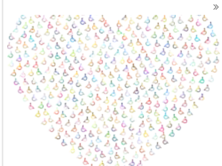
FISH Umbria Onlus: le persone non autosufficienti rischiano l'oblio