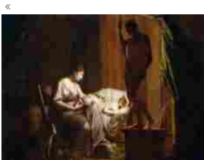
Ulisse. L'arte e il mito: la mostra candidata al Global Fine Art Awards

Appuntamenti almanacco barbanera , pianeta, unesco