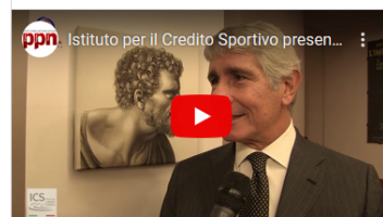
Istituto per il Credito Sportivo presenta "THE MISSING NAIL"