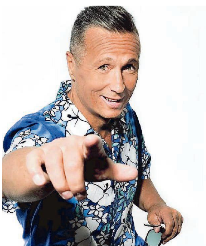
Per la prima volta Paolo Belli sarà accompagnato sul palco da una brass band: proporrà anche i suoi grandi successi

Paolo Belli, già noto alla fine degli anni Ottanta col suo primo album "Ladri di biciclette", ha tenuto centinaia di concerti, tre partecipazioni a Sanremo e due vittorie al Festivalbar, e ha collaborato con artisti prestigiosi quali Sam Moore, Dan Aykroyd, Jimmy Whitterspoon, Vasco Rossi, Piero Chiambretti, Enzo Jannacci, Fabio Fazio, Litfiba e molti altri. Un rilancio di notorietà l'ha avuto con lo show televisivo di Rai 1 "Ballando con le stel-