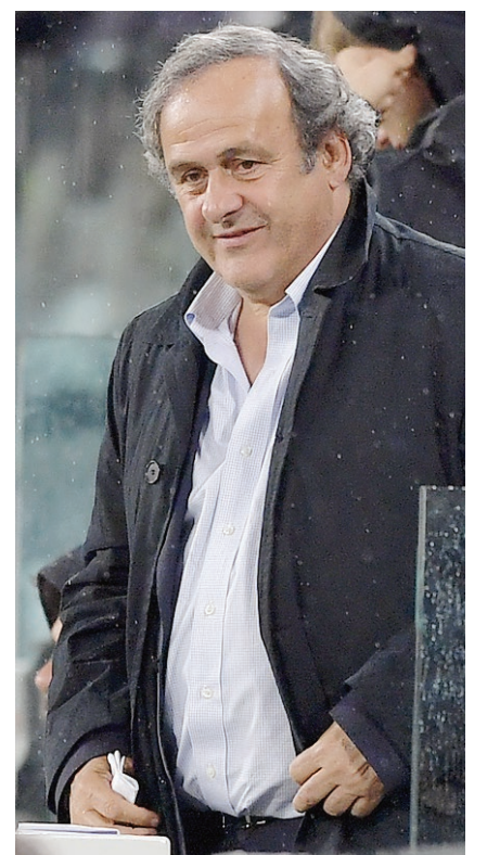
Michel Platini, 63 anni, tecnico dei Campioni