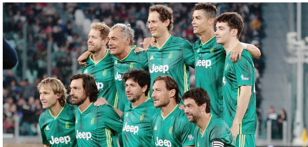
Cristiano Ronaldo ha guidato la squadra dei campioni per la ricerca

DAI BIGLIETTI 490 MILA EURO, ORA SUPERARE QUOTA 2,1 MILIONI I FONDI RACCOLTI SARANNO DEVOLUTI A CANDIOLO E A TELETHON