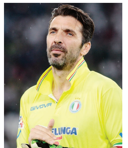
Gigi Buffon, 41 anni

LA PARTITA CHE HA ANCORA ACCESSO LA PASSIONE ALL'ALLIANZ STADIUM, SARÀ TRASMESSA OGGI IN TELEVISIONE ALLE 21.25 SU RAI 1