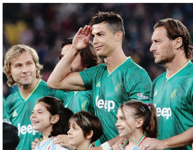
Il portoghese tra Pavel Nedved, 46 anni, e Francesco Totti, 42