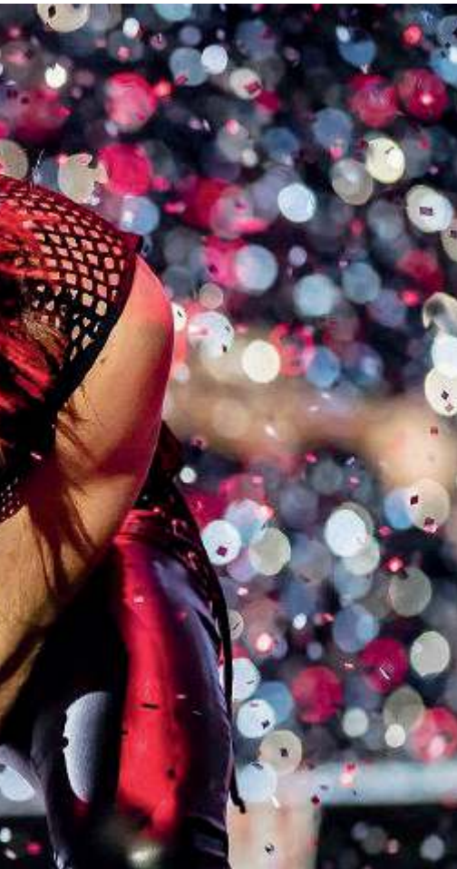
Pattinaggio sul ghiaccio di fronte al mare a Cesenatico, spettacolo della compagnia Eventi Verticali in piazza Saffi a Forlì