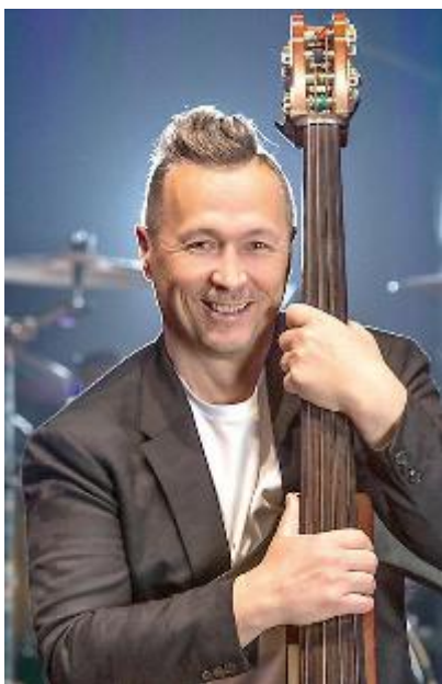
Il musicista Paolo Belli sarà sul palco del teatro Aurora il 10 gennaio

AURORADISERA , i grandi nomi del teatro arrivano a Scandicci. E' aperta la campagna abbonamenti per la rassegna che partirà dal 10 gennaio al Teatro Aurora. Novità dell'edizione 2019 è l'anteprima - fuori abbonamento - martedì 11 dicembre 2018, con Gli Omini e il loro grande successo «L'asta del Santo», uno spettacolo ma anche un gioco, una rifica - il Mercante in fiera - in cui in palcoscenico le vite dei santi e 5 abbonamenti della rassegna 2019, che verranno estratti a sorte fra gli spettatori della serata. Posto unico 5 euro. Ecco le modalità per abbonarsi: basta andare al teatro Aurora da mercoledì 12 a venerdì 14 dalle 17 alle 20 (per la prelaione); il 17 e 18, stessa ora per il cambio posti e le sottoscrizioni ex abbonati; i dal 19 a al 21 (ore 17-20), sabato 22 (ore 10-13), 27 e 28 (ore 17-20), sabato 29 (ore 10-13). I nuovi abbonamenti ai cinque spettacoli costano 60 euro gli interi e 55 euro i ridotti e sono in vendita dal 3 gennaio. La rassegna è ideata dalla Fondazione Toscana Spettacolo e dal Comune di Scandicci. In cartellone Paolo Belli (10.1), Valentina Lodovini (30.1), Maria Cassi (14.2), Federico Buffa (15.3), Tullio Solenghi (8.4).