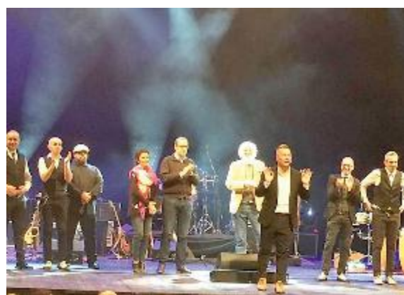
SOLIDARIETÀ Paolo Belli in scena a Fano