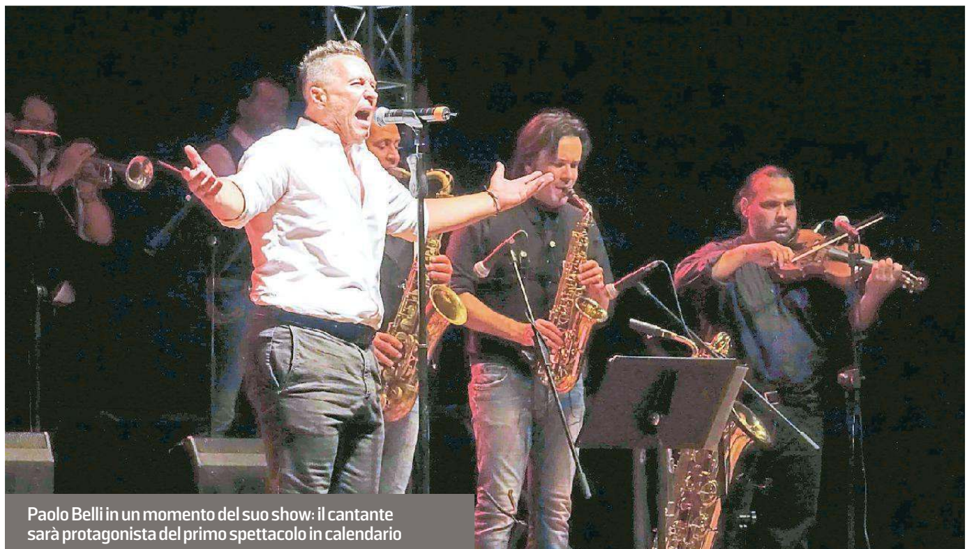
Paolo Belli in un momento del suo show: il cantante sarà protagonista del primo spettacolo in calendario