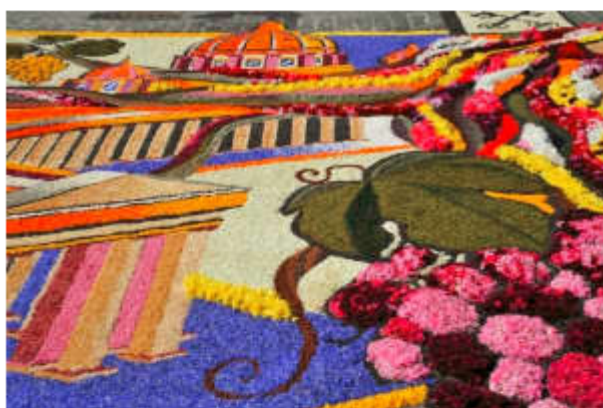
Infiorate di Spello

Le infiorate di Spello è diventata ormai la manifestazione principale della cittadina umbra. In occasione della Festa del Corpus Domini la città si sposa con i fiori che adornano 2 km di strade con opere artistiche di straordinaria bellezza. Questa bella manifestazione è ora inserita nel calendario italiano dell'Anno europeo del patrimonio culturale 2018.