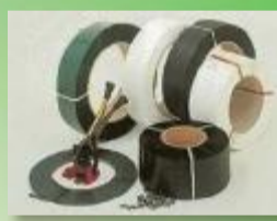
REGGIA IN PPL / PET / ACCIAIO e ACCESSORI