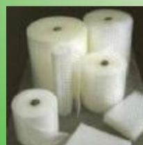
Materiale in BOLLE D'ARIA (BOBINE, BUSTE, TUBOLARI, ECC.)