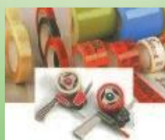
NASTRI DA IMBALLO (neutri e personalizzati) NASTRI SPECIALI: RINFORZATI, CARTA, BIADESIVI