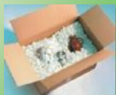
Materiale in POLISTIROLO normale ed ecologico

MONDAL S.R.L. 37141 Montorio Veronese (VR) via Lanificio, 84 - Tel. 045.8840830 - Fax 045.8840769