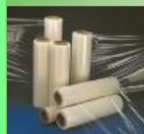
ESTENSIBILE neutro, colorato e personalizzato ESTENSIBILE BABY