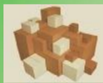
SCATOLE / FOGLI / ANGOLARI IN CARTONE

oppure mandare una e-mail a mondal@mondal.it