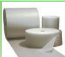
Materiale in ESPANSO e GOMMAPIUMA