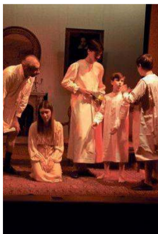
Una scena dello spettacolo

Continuano con successo le repliche de "Il Fantasma di Canterville" di Oscar Wilde portato in scena dalla Campogalliani.