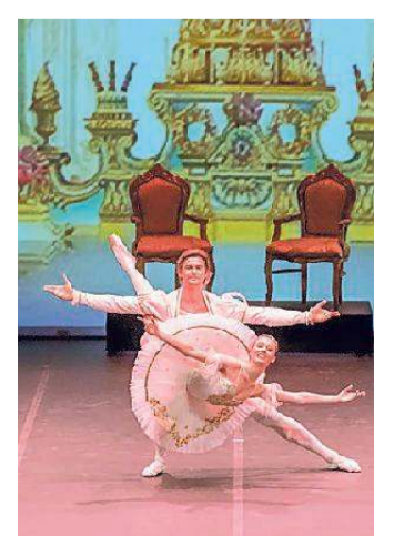
Una scena dello Schiaccianoci

to. Balletto adatto a tutta la famiglia, sarà interpretato e danzato dagli allievi della scuola e dalla Compagnia Junior del Balletto di Verona ad eccezione dei ruoli principali della Fata Confetto e del suo principe che in questa occasione saranno interpretati dagli artisti ospiti Chiara Uderzo e Vladimir Shishov del Teatro dell'Opera di Vienna. I biglietti possono essere già acquistati alla biglietteria del teatro (martedì dalle 10.30 alle 12.30, da mercoledì al sabato 17.30-19.30 e nei giorni di spettacolo 3 ore prima dello stesso) o su www.teatrosocialemantova.it . Prezzi: platea e palchi 42 euro - ridotto 35; loggia e loggione 30 euro - ridotto 25.