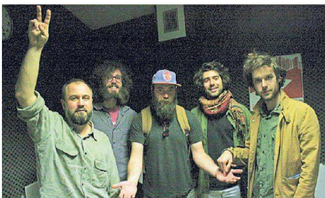
Il collettivo “C+C=Maxigross” ospite venerdì all’Archi Tom

bum ed ep suonando in lungo e in largo tra Italia, Europa e Stati Uniti. La formazione del collettivo cambia in base al tour e al progetto coinvolgendo artisti da tutto il mondo, «così da poter generare ogni volta una nuova opportunità di scambio umano e musicale». Sottoscrizione 5 euro con tessera Arci 2018.