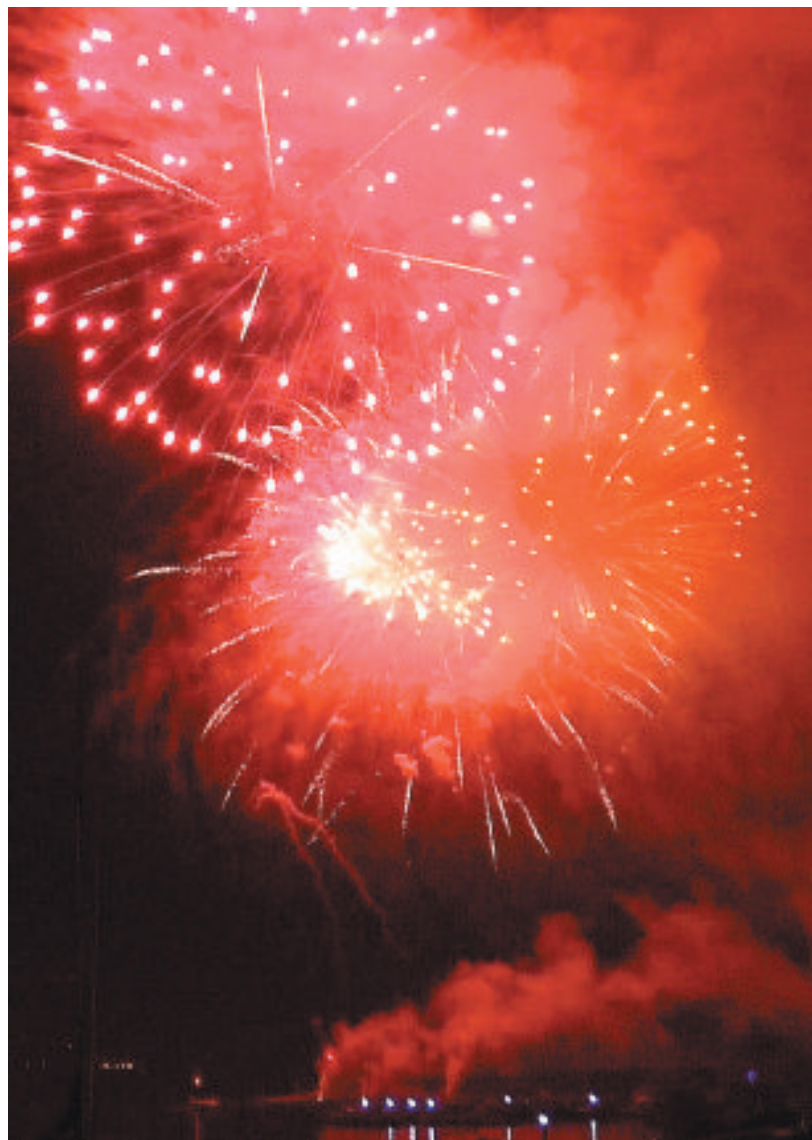
Lo spettacolo dei fuochi artificiali che hanno salutato il 2018