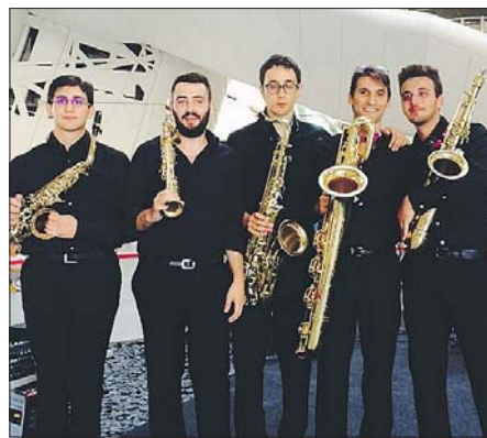
Concerto Musicisti del Briccialdi oggi in ospedale

formazioni che hanno rappresentato i Conservatori italiani all'Expo di Milano. Questo è il primo dei tre appuntamenti musicali programmati per il 2015 dalla direzione dell'Azienda ospedaliera Santa Maria e dalla direzione dell'Istituto Superiore di Studi musicali Giulio Briccialdi, con l'obiettivo di contribuire a dare conforto a tutti quei pazienti ricoverati e ai relativi familiari che si trovano ad affrontare una malattia e un momento difficile della propria vita. ◀