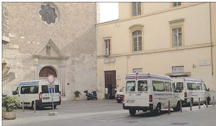
Sagrato ridotto a parcheggio Sarà ancora così per molto dopo il flop del trasferimento