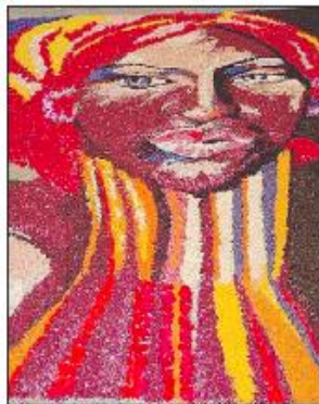
Tappeto di fiori Le mani esperte degli infioratori regalano opere incredibili