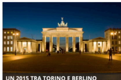
UN 2015 TRA TORINO E BERLINO