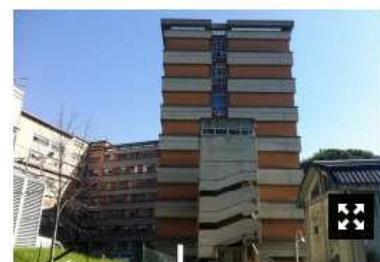
L'OSPEDALE DI TERNI

Il reparto deve essere spostato all'interno del nosocomio, ma le procedure sono lente e manca il personale